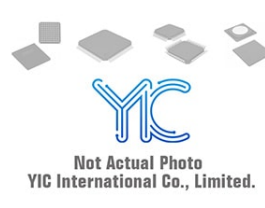
AT93C46-10SU2.7 AT AT93C46-10SU2.7 AT