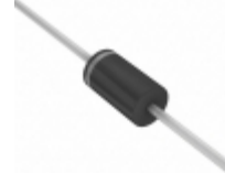
STTH5L06RL STMicroelectronics DIODE GEN PURP 600V 5A DO201AD