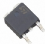
STTH5R06BY-TR STMicroelectronics DIODE GEN PURP 600V 5A DPAK