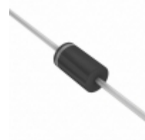
STTH5L06 STMicroelectronics DIODE GEN PURP 600V 5A DO201AD