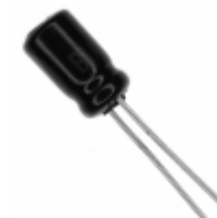
ECE-A1AKA470I Panasonic Electronic Components CAP ALUM 47UF 20% 10V RADIAL