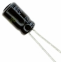
ECE-A1AKA330 Panasonic Electronic Components CAP ALUM 33UF 20% 10V RADIAL