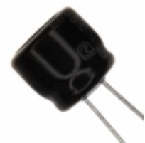
ECE-A1AKA221Q Panasonic Electronic Components CAP ALUM 220UF 20% 10V RADIAL