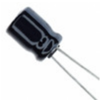
ECE-A1AKA470 Panasonic Electronic Components CAP ALUM 47UF 20% 10V RADIAL