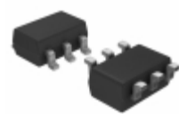
TC1073-2.6VCH713 Microchip Technology IC REG LDO 2.6V 0.1A SOT23-6