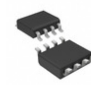
STM690AM6E STMicroelectronics IC SUPERVISOR SWITCH OVER 8-SOIC