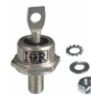
VS-70HFLR40S05 Vishay Semiconductor Diodes Division DIODE GEN PURP 400V 70A DO203AB