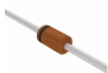
MTZJ27SC R0G TSC (Taiwan Semiconductor) DIODE ZENER 26.29V 500MW DO34