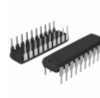
A6277EA-T Allegro MicroSystems, LLC IC LED DRIVER LINEAR 120MA 20DIP