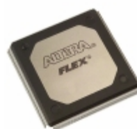
EP20K200RC240-1N Altera IC FPGA 174 I/O 240RQFP