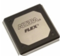
EP20K200RC240-3V Altera IC FPGA 174 I/O 240RQFP