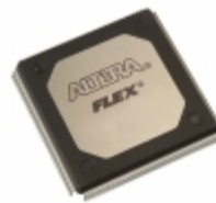
EP20K200RC240-3 Altera IC FPGA 174 I/O 240RQFP