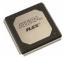
EP20K200RC240-2 Altera IC FPGA 174 I/O 240RQFP