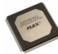
EP20K200RC240-1X Altera IC FPGA 174 I/O 240RQFP