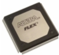
EP20K200RC240-2X Altera IC FPGA 174 I/O 240RQFP