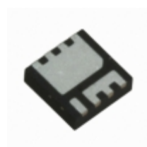
IRFH5302TRPBF Infineon Technologies MOSFET N-CH 30V 32A 5X6 PQFN