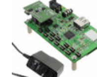
BU94603_EVK LAPIS Semiconductor BOARD EVAL FOR BU94603