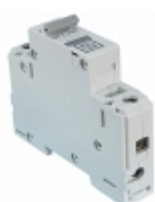
4420.0232 Schurter Inc. CIR BRKR THRM MAG 25A 277V 65V