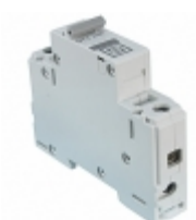
4420.0229 Schurter Inc. CIR BRKR THRM MAG 3A 277V 65V