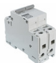
4420.0235 Schurter Inc. CIR BRKR THRM MAG 2A 480V 65V