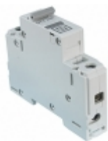
4420.023 Schurter Inc. CIR BRKR THRM MAG 2A 277V 65V