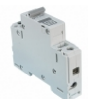
4420.0233 Schurter Inc. CIR BRKR THRM MAG 30A 277V 65V