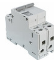
4420.0236 Schurter Inc. CIR BRKR THRM MAG 4A 480V 65V