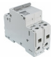
4420.0237 Schurter Inc. CIR BRKR THRM MAG 5A 480V 65V