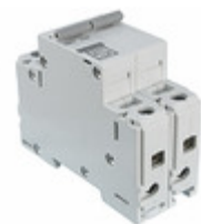
4420.0239 Schurter Inc. CIR BRKR THRM MAG 20A 480V 65V