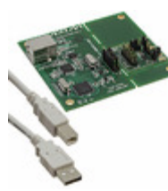
MAX5422EVKIT+ Maxim Integrated KIT EVAL MAX5422 MAX5423 MAX5424