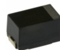
EEF-SE0E391R Panasonic Electronic Components CAP ALUM POLY 390UF 20% 2.5V SMD