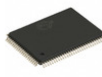
CY7C1370DV25-200AXC Cypress Semiconductor Corp IC SRAM 18MBIT 200MHZ 100TQFP