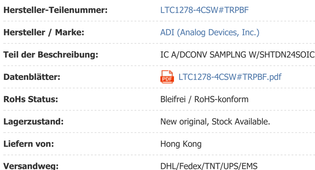
Image may be representation. See specs for product details.