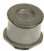
CG2470SN Littelfuse Inc. GDT 470V 20KA