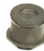
CG2470MS Littelfuse Inc. GDT 470V 20KA SURFACE MOUNT