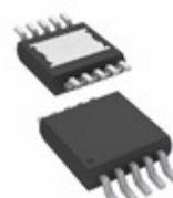
A8513KLYTR-T Allegro MicroSystems, LLC IC LED DRIVER RGLTR DIM 10MSOP