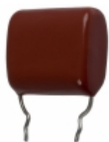
ECQ-P1H334GZW Panasonic Electronic Components CAP FILM 0.33UF 2% 50VDC RADIAL