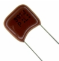
ECQ-P1H391JZ Panasonic Electronic Components CAP FILM 390PF 5% 50VDC RADIAL