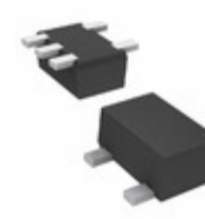
DMC562000R Panasonic Electronic Components TRANS 2NPN PREBIAS 0.15W SMINI5