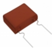
ECW-F2155JAB Panasonic Electronic Components CAP FILM 1.5UF 5% 250VDC RADIAL