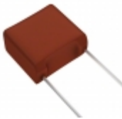
ECW-F2155HA Panasonic Electronic Components CAP FILM 1.5UF 3% 250VDC RADIAL