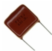
ECQ-P6273JU Panasonic Electronic Components CAP FILM 0.027UF 5% 630VDC RAD