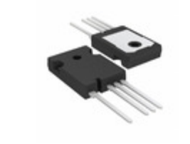
FGH75T65SHDTL4 Fairchild/ON Semiconductor IGBT 650V 150A 455W TO-247