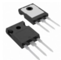
FGH75T65SHDT_F155 Fairchild/ON Semiconductor IGBT 650V 150A 455W TO-247