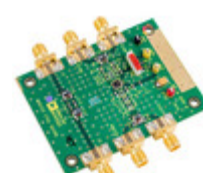
AD8352-EVALZ Analog Devices Inc. BOARD EVAL FOR AD8352