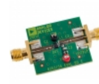
AD8353-EVALZ Analog Devices Inc. BOARD EVAL FOR AD8353ACP