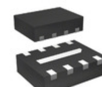
AD8353ACP-R2 Analog Devices Inc. IC RF GAIN BLOCK 8-LFCSP