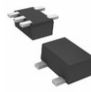
DMC561070R Panasonic Electronic Components TRANS 2NPN PREBIAS 0.15W SMINI5