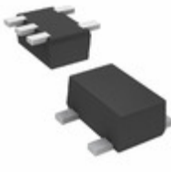
DMC5610N0R Panasonic Electronic Components TRANS 2NPN PREBIAS 0.15W SMINI5