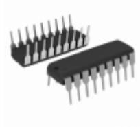
MIC2981/82BN Microchip Technology IC DRIVER ARRAY HV/HC 8CH 18DIP