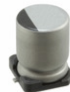
UUR1H470MNL1GS Nichicon CAP ALUM 47UF 20% 50V SMD