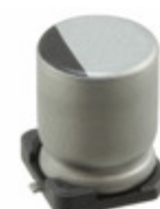
UUR1J220MNL1GS Nichicon CAP ALUM 22UF 20% 63V SMD