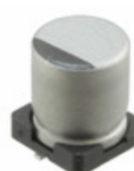
UUR1H330MCL6GS Nichicon CAP ALUM 33UF 20% 50V SMD