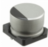
UUR1H330MCL1GS Nichicon CAP ALUM 33UF 20% 50V SMD