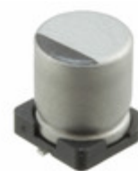
UUR1V101MCL6GS Nichicon CAP ALUM 100UF 20% 35V SMD