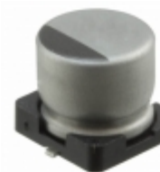
UUR1J4R7MCL1GS Nichicon CAP ALUM 4.7UF 20% 63V SMD