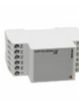
DLA71DB232P Carlo Gavazzi 115/230V 2 PUMP ALTERNATING RLY