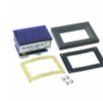
DLA20-LM-B-1 C-Ton Industries VOLTMETER PANEL MOUNT