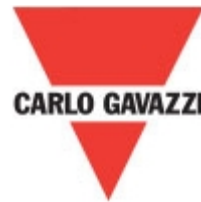
DLA71TB233P Carlo Gavazzi 3 PUMP ALTERNATING RELAY