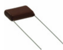
ECQ-E2684RKF Panasonic Electronic Components CAP FILM 0.68UF 5% 250VDC RADIAL