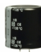
ECO-S2DB122EA Panasonic Electronic Components CAP ALUM 1200UF 20% 200V SNAP