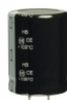
ECO-S2DB122DA Panasonic Electronic Components CAP ALUM 1200UF 20% 200V SNAP