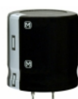
ECO-S2DA681DA Panasonic Electronic Components CAP ALUM 680UF 20% 200V SNAP