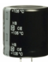
ECO-S2DB122EH Panasonic Electronic Components CAP ALUM 1200UF 20% 200V SNAP