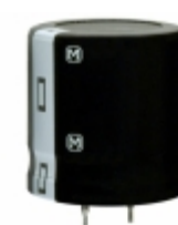
ECO-S2DA561DA Panasonic Electronic Components CAP ALUM 560UF 20% 200V SNAP