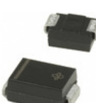
SMBJ51-E3/52 Vishay Semiconductor Diodes Division TVS DIODE 51VWM 91.1VC SMB