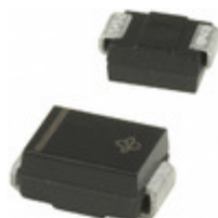
SMBJ51-E3/5B Vishay Semiconductor Diodes Division TVS DIODE 51VWM 91.1VC SMB