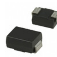
SMBJ51A Fairchild/ON Semiconductor TVS DIODE 51VWM 82.4VC SMB