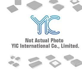
AD5667RBCPZ AD AD DFN