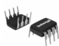
ISL84544IP Intersil IC SWITCH SPDT 8DIP