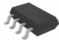
LTC2955CTS8-2#TRMPBF Linear Technology IC CTRL ON/OFF PUSHBUUTT TSOT23-8