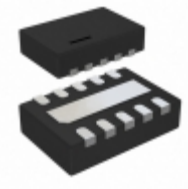
LTC2955IDDB-1#TRMPBF Linear Technology IC CTRL ON/OFF PUSHBUTTON 10-DFN