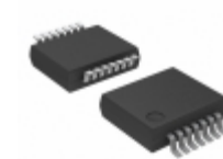
74HC27DB,112 Nexperia USA Inc. IC GATE NOR 3CH 3-INP 14-SSOP