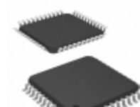
ATF1504ASV-15AI44 Microchip Technology IC CPLD 64MC 15NS 44TQFP