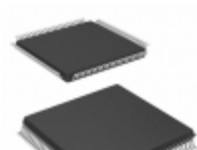
ATF1504ASV-15AC100 Microchip Technology IC CPLD 64MC 15NS 100TQFP