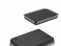
ATF1504ASL-25QI100 Microchip Technology IC CPLD 64MC 25NS 100QFP