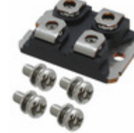
VS-UFB130FA20 Electro-Films (EFI) / Vishay DIODE MODULE 200V 65A SOT227