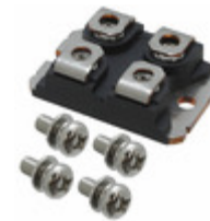
VS-UFB130FA20 Vishay Semiconductor Diodes Division DIODE MODULE 200V 65A SOT227