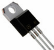
BUL49D STMicroelectronics TRANS NPN 450V 5A TO-220