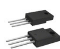
BUL49DFP STMicroelectronics TRANS NPN 450V 5A TO-220FP