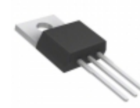
BT139-600-0Q WeEn Semiconductors Co., Ltd BT139-600-0/SIL3P/STANDARD MAR