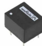
NKE0509DC Murata Power Solutions Inc. DC/DC CONVERTER 9V 1W