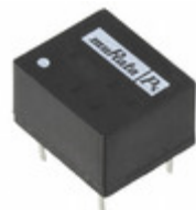
NKE0309DC Murata Power Solutions Inc. DC/DC CONVERTER 9V 1W DIP