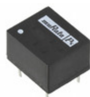
NKE0505DEC Murata Power Solutions Inc. DC/DC CONVERTER 5V 1W