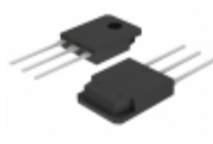
CLA80MT1200NHB IXYS THYRISTOR PHASE TO247-3