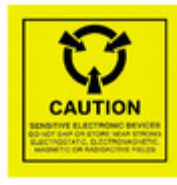
CLABEL4X4 SCS LABEL ESD/STATIC 4"X4" 100PC