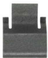
CLAMP04 Apex Microtechnology CLAMP TO220 USE WITH HS29