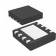
MCP4901-E/MC Microchip Technology DAC 8BIT SGL 1CH W/SPI 8DFN