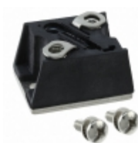
VS-T40HF20 Vishay Semiconductor Diodes Division DIODE MODULE 200V 40A D-55