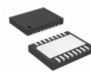
LTC2368CDE-16#PBF Linear Technology IC ADC 16BIT 1MSPS SPI 16DFN