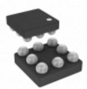
AD8506ACBZ-REEL7 Analog Devices Inc. IC OPAMP GP 95KHZ RRO 8WLCSP