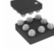
AD8506ACBZ-REEL Analog Devices Inc. IC OPAMP GP 95KHZ RRO 8WLCSP