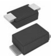
SE20FJ-M3/I Electro-Films (EFI) / Vishay DIODE GEN PURP 600V 1.7A DO219AB