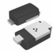
SE20PAJ-M3/I Electro-Films (EFI) / Vishay DIODE GEN PURP 600V 1.6A DO220AA