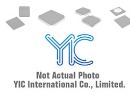
BA033CC0FP-FE2 ROHM BA033CC0FP-FE2 ROHM