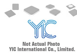
BA032LBSG-TR ROHM BA032LBSG-TR ROHM