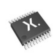
74LVC2245APW,112 Nexperia IC TXRX NON-INVERT 3.6V 20TSSOP