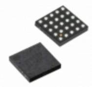
BU26507GUL-E2 Rohm Semiconductor IC LED DRVR