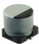
EEE-FT1C221AP Panasonic Electronic Components CAP ALUM 220UF 20% 16V SMD