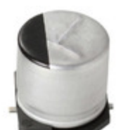
EEE-FT1C122UP Panasonic CAP ALUM 1200UF 20% 16V SMD