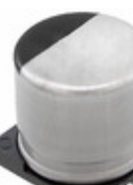
EEE-FT1A152GP Panasonic Electronic Components CAP ALUM 1500UF 20% 10V SMD