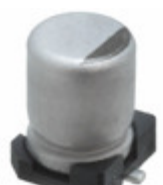
EEE-FT1C680AR Panasonic Electronic Components CAP ALUM 68UF 20% 16V SMD