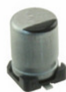
EEE-FT1C470AR Panasonic Electronic Components CAP ALUM 47UF 20% 16V SMD