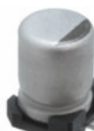
EEE-FT1C101AR Panasonic Electronic Components CAP ALUM 100UF 20% 16V SMD